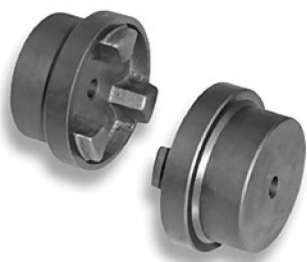
Полумуфта с черновым отверстием под расточку