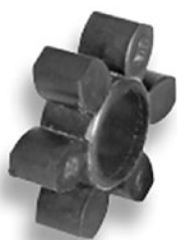
Упругий элемент «паук»